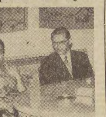
W dniu 17 października 1963 r. przewodniczący Rady Państwa A. Zawadzki przyjął, przybyłą z wizytą do Polski, premiera Cejlonu p. S. Bandaranaike. W czasie wizyty obecny był minister spraw zagranicznych A. Rapacki. Na zdjęciu: (od prawej) A. Zawadzki, S. Bandaranaike i A. Rapacki.

decznej atmosferze, Sirimavo R. D. Bandaranaike i Józef Cyrankiewicz wymienili toasty.