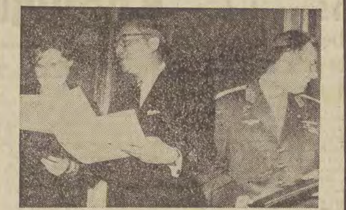
Sekretarz generalny ONZ, U Thant, z Walentyną Tierszkową i Jurijem Gagarinem podczas wizyty kosmonautów radzieckich w siedzibie ONZ w Nowym Jorku.