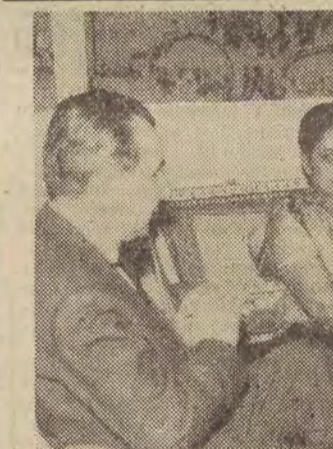
W dniu 17 października 1963 r. przewodniczący Rady Państwa A. Zawadzki przyjął, przybyłą z wizytą do Polski, premiera Cejlonu p. S. Bandaranaike. W czasie wizyty obecny był minister spraw zagranicznych A. Rapacki. Na zdjęciu: (od prawej) A. Zawadzki, S. Bandaranaike i A. Rapacki.

Na lotnisku delegację żegnał: członek Biura Politycznego minister obrony narodowej, marszałek Polski M. Spychalski, sekretarz KC PZPR, R. Strzelecki, wicepremier J. Tokarski, generał, przedstawiciel społeczno-wojskowy.