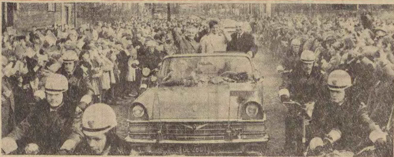
Na ulicach Łodzi.