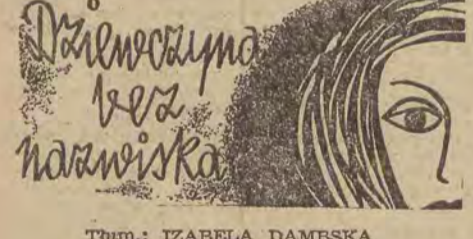
Tłum.: IZABELA DĄBESKA