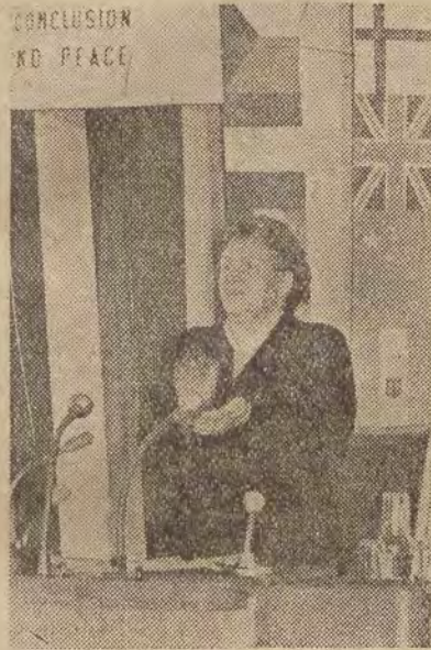
Przewodnicząca Demokratycznego Związku Kobiet Niemieckich, Elli Schmidt, otwiera obrady sesji Światowej Federacji Kobiet Demokratycznych w Berlinie.

kój, tzn. o możliwość spokojnej pracy, o życie dzieci.