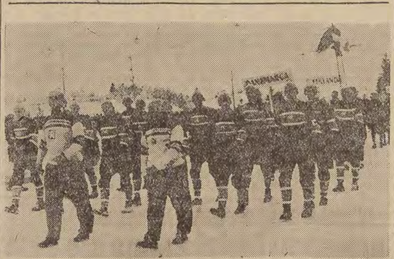
W Polanie-Stalin zakończone zostały I mowe Akademickie Mistrzostwa Świata. Na zdjęciu — defilada zawodników. Na czele akademicy Czechosłowacji, a dalej Danił, Finlandii i N. R. D. — Polacy na mistrzostwach tych zdobyli: 4 złote medale, 3 srebrne i 6 brązowych.

Ekipa polska otoczona jest troskliwą opieką. W dniu 7 bm. łyżwiarce nasi zwiedzili Kreml.