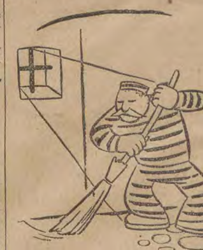
Katy aresztu i przynany nalożono na kilka dozorców za antysanitarny stan nieruchomości (z przesy).

Od kilku dni w mięsnych sklepach pojawiły się stopy świątecznych szynki. Zapobiegliwe łódzianki już w pierwszy dzień starały się zaopatrzyć w nie swoje rodziny. Te zaś, które pierwszego dnia nie uczyniły tego, nie potrzebują się martwić, bo CZEMSA ma na składzie jeszcze wiele szynki i będzie codziennie zaopatrywał w nie wszystkie sklepy.