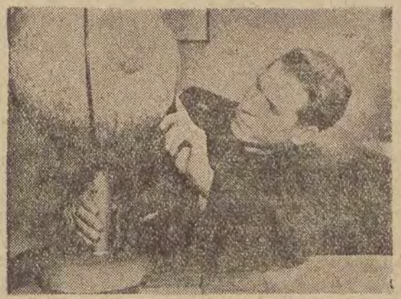
W szkole czy w fabryce, podnosząc wyniki nauki i podejmując zobowiązania produkcyjne, młodzież polska łączy walkę o pokój z walką o Plan 6-letni. Swą codzienną pracą wyraża jak najściślej solidarność z walczącą o pokój młodzieżą całego świata.