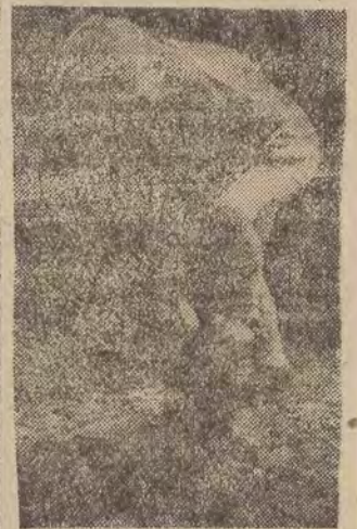
Ogródki działkowe - to zdrowie nas i dla naszych dzieci.

Dzisiaj pierwszy dzień wiosny! Tak się w tym roku złożyło, że wiosna kalendarzowa przyniosła nam upragnione, mile, wiosenne