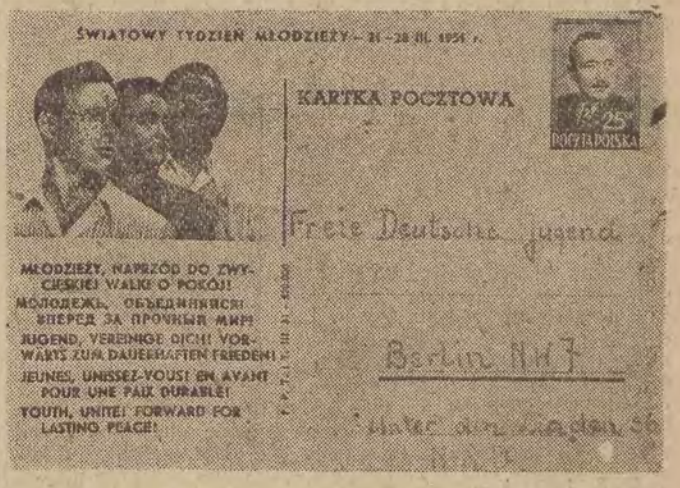
W związku z nadchodzącym Tygodniem Światowej Federacji Młodzieży Demokratycznej, Zarząd Główny ZMP wydał pocztówkę, która reprodukuje na zdjęciu. Pocztówki te wysła młodzież polska w okresie Tygodnia, aby nawiązać stałą korespondencję z młodzieżą całego świata.

kosztach wydobycia węgla w ramach jednolitego rynku wpływać będą z jednej strony — na obniżenie plac we Francji i Belgii do poziomu plac w Niemczech, a z drugiej na ograniczenie produkcji we Francji i Belgii — i na zamknięcie kopalń. W kołach gospodarczych za znacza się, że plan Schumana doprowadzi do dalszego ograniczenia produkcji przemysłu Francji i krajów Beneluxu. Koszty własne wydobycia tony węgla w Niemczech wynoszą 2.750 franków, we Francji — 3.400 franków, w Belgii — 4.250 franków. Jest