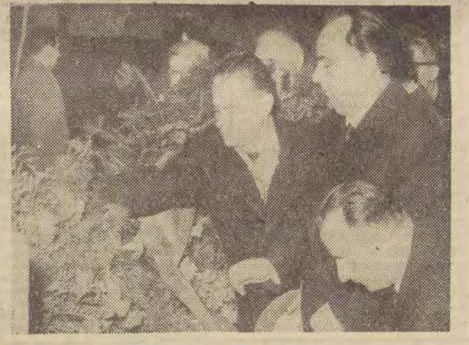
Moment składania wieńców.

Uroczysty koncert rozpoczęło „Międzynarodówka” w wykonaniu chóru i orkiestry Filharmonii Łódzkiej. Orkiestra pod batutą dyrygenta S. Harezyka i z udziałem solistów wykonała bogaty program, na który złożyły się utwory kompozytorów polskich i radzieckich. (wyrz.)