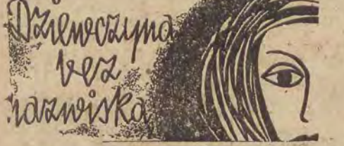
Tłum.: IZABELA DAMBSKA

Usłyszała głęboki piensowy śmiech lady Moron: „Zdaje mi się, Chesney, że dzisiaj podjęłam jeszcze większe!”