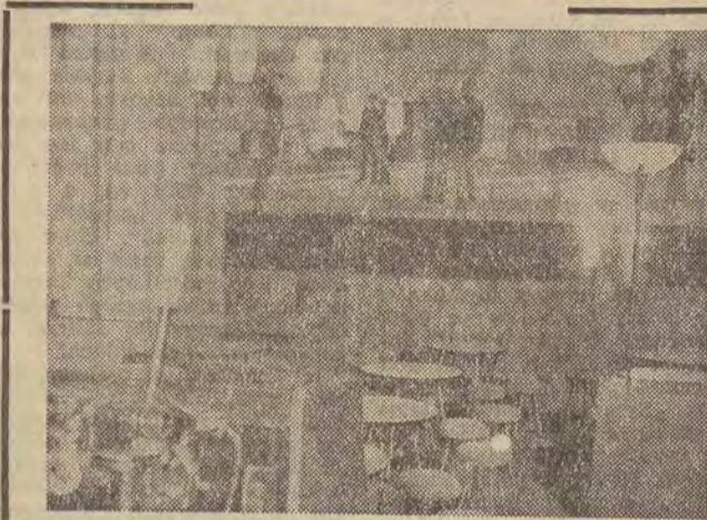
Studenci w Łodzi cudzoziemcy pochodzący z Afryki — jako pierwsi w Polsce otrzymują dzisiaj w lokalu przy ul. Zachodniej 12 swój własny klub — Klub Młodej Afryki. Powstał on — z inicjatywy łódzkiego oddziału Tow. Przyjaciół Polsko-Afrykańskiej — jako filia Klubu Międzynarodowej Prasy i Książki. Nie będzie to więc tylko kawiarnia, ale i czytelnia z prasą i książkami zagranicznymi.