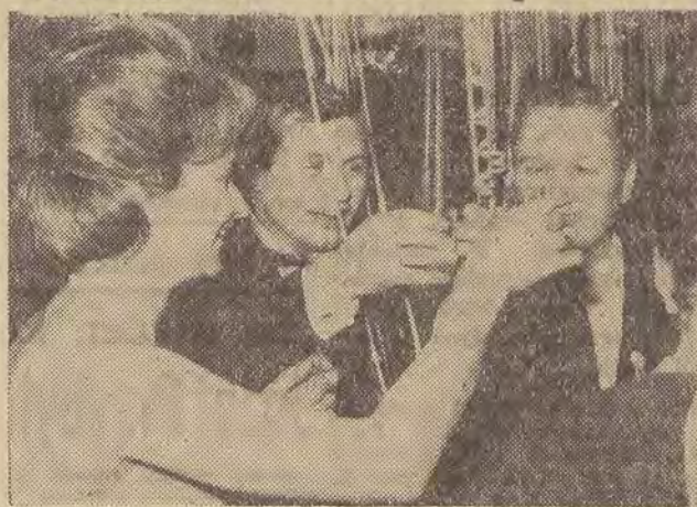
Tak więc Nowy Rok powitał nas radośnie i spokojnie. J. Kr.

W tę noc ulica była pełna ruchu, gwaru, pośpiechu... Kto żyw, podążał na zabawę sylwestrową bądź „prywatną“, by w gronie przyjaciół powitać Nowy Rok. Złapać wolną takówkę było nie lada sztuką. W tramwajach panie troskliwie chroniły pod jedwabnymi chustkami fryzury, zdobyte kosztem wielu wycieczek i kilkunastu godzin oczekiwania u fryzjera. Na każdym rogu sprzedawcy oferowali tradycyjne baloniki, bez których nie można sobie wyobrazić zabawy sylwestrowej. A takich zabaw było w Łodzi około 100.