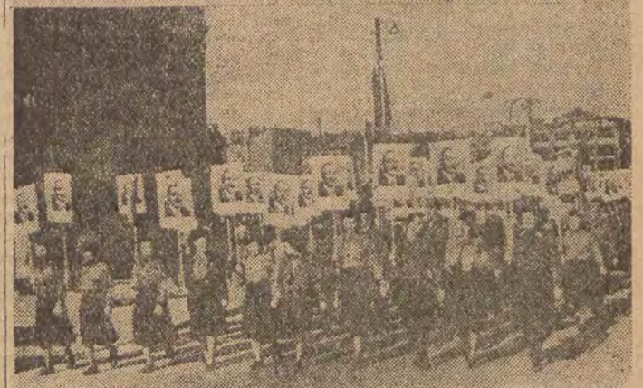
ZDJĘCIE U GÓRY: Dnia 22 bm. Prezydent Bolesław Bierut i towarzyszące mu osoby wraz z Premierem NRD Otto Grotewohlem i Wicepremierem NRD udali się do Mauzoleum żołnierzy radzieckich w parku Treptow. Na zdjęciu: pod pomnikiem Żołnierza Radzieckiego. NA ZDJĘCIU U DOŁU: Tysiączne rzesze młodzieży niemieckiej udają się z portretami Prezydenta Bieruta na Dworzec Wschodni w Berlinie, by powitać Prezydenta R. P.