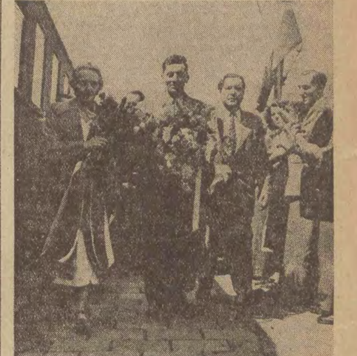
Dnia 26 czerwca br. przybył do Warszawy przewodniczący Światowej Rady Pokoju — prof. Joliot-Curie wraz z małżonką Ireną Curie, aby wziąć udział w obradach Kongresu Nauki Polskiej, który rozpocznie się w Warszawie w dniu 29 czerwca 1951 r. NA ZDJĘCIU: Prof. Joliot-Curie i Irena Curie w czasie powitania na Dworcu Głównym w Warszawie.

MOSKWA, 27.6. Agencja TASS podaje z Delhi: Do Bombaju przybył 19 z rządu handlowy statek radziecki z ładunkiem 7.234 ton pszenicy radzieckiej.