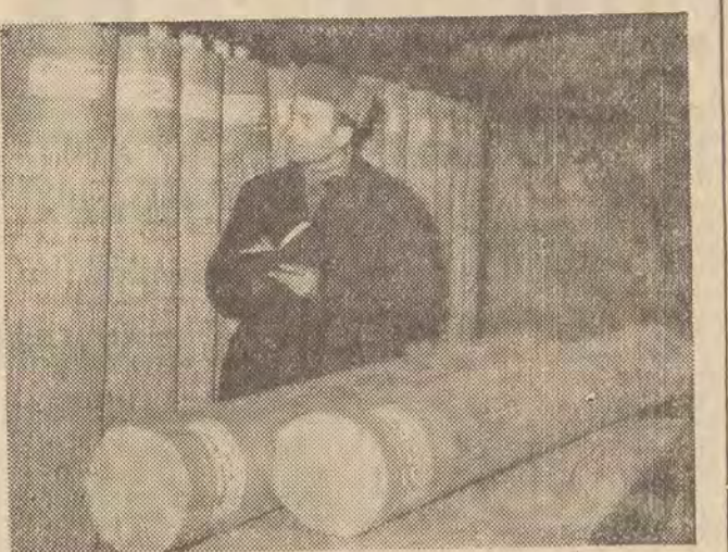
Pańskie Zakłady Prefabrykatów Trzciny (przemysł terenowy) produkują rocznie około 900 tysięcy metrów kwadratowych płyt i mat trzciny. Blisko połowa produkcji kierowana jest na eksport m. in. do Stanów Zjednoczonych AP. i do krajów afrykańskich. Na zdjęciu: rolę mat trzciny przygotowane na eksport do USA.

torium, a jednocześnie misja francuska wystąpiła z twierdzeniem, że księża katolicyści mają prawo do zamknięcia się w ramach klasycznego nacjonalizmu, a ewangelizacja nie może być pretekstem do panowania jednego narodu nad drugim.