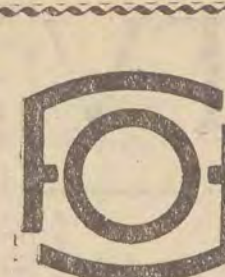
Foto - optyka