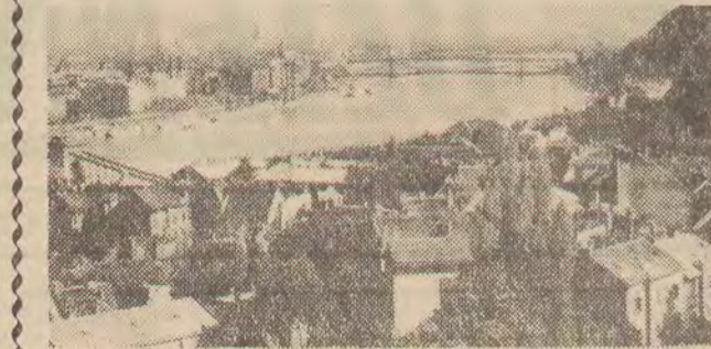
Na zdjęciu: panorama Budapesztu.

W dniu dzisiejszym Węgry obchodzą swoje narodowe święto. Tradycje przyjaźni polsko-węgierskiej, przysiężnik między oboma narodami sięgają wielu, wielu lat. Dziś, gdy oba nasze kraje kroczą szlakiem budownictwa socjalistycznego, więzy te są szczególnie mocne.