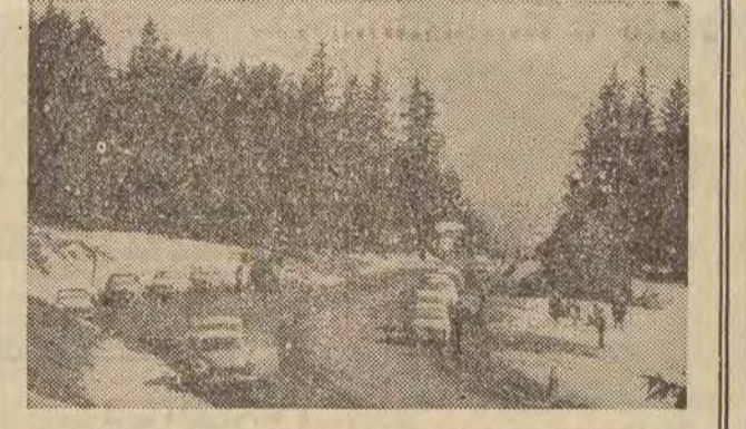
Przebiegająca przez Poronina przez Bukowinę Tatrzkańską, Głodówkę i Łysą Polanę mkną setki samochodów do Morskiego Oka. Szczególnie sobota i niedziela są dniami, w których wielu zmotoryzowanych turystów jedzie na niedzielny wypocinek. Spotkać tu można „samochodziarzy” z całego kraju. Dominują naturalnie turyści z pobliskiego Krakowa i Katowic. Wiosenny sezon turystyczny rozpoczął się na dobre. Na zdjęciu: Głodówka, w drodze do Morskiego Oka. Przebieknie widoki zatrzymują tu turystów na krótki wypocinek.

antyamerykańskiej również posiada swoją własną kartotekę, gdzie zarejestrowanych jest ponad milion osób. Agenci FBI udzielają się także prywatnie, pracując jako inspektorzy w przedsiębiorstwach detektywistycznych, które mnożą się ostatnio jak grzyby po deszczu. Towarzystwo pod niewinną nazwą „Retail Credit Company” (towarzystwo kredytowe handlu detalicznego) zatrudnia ponad 6 tysięcy inspektorów, którzy „rozpracowują” dziennie około 90 tysięcy obywateli amerykańskich ubiegających się o posadę czy pragnących uzyskać kredyt w banku.