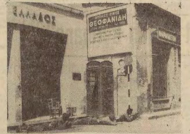
Na zdjęciu: policjanci-Grecy cypryjscy na pozycji w Nikozji.

W nocy z poniedziałku na wtorek gen. Gyani przesłał sekretarzowi generalnemu ONZ, U Thantowi, szczegółowy raport w sprawie sytuacji na Cyprze. Część eskadry wojennej, zakotwiczonej w porcie Iskenderun — grupa 7 okrętów — wypłynęła na nowe manewry w obszarze położonym między południowymi wybrzeżami Turcji i Cypru.