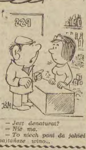
- Jest denaturat? - Nie ma. - To niech pani da jakieś najtańsze wino...