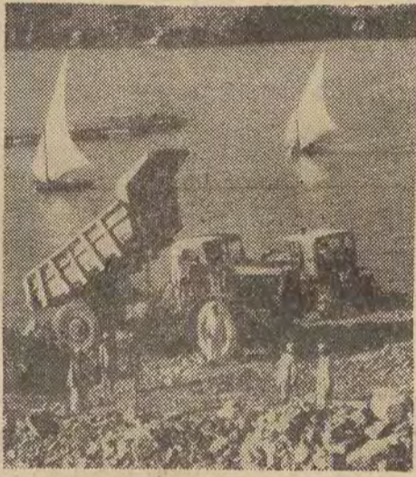
Żelazówki wozą materiał, z którego powstanie tama. W głębi, na Nilu — tradycyjne łodzie egipskie „felucca”.

— Trudno je przecenić. Jest ono ogromne. Asuańska zapora jest kontynuacją naszej walki przeciw imperializmowi na niezmierzonym wschodzie — w dziedzinie ekonomicznej. Saad el Ali stanie się jedną z podwalin niezależności ZRA. Jest ona i będzie dla wszystkich krajów wchodzących na drogę wyzwolenia spod panowania monopolu imperialistycznego — wymownym przykładem możliwości stworzenia własnej narodowej gospodarki. Fakt, że przy wzroszeniu wielkiej budowy przyszedł nam z pomocą kraj socjalistyczny, Związek Radziecki, dowodzi wszystkim, że imperialiści nie mogą już dyktować swych warunków w międzynarodowych stosunkach ekonomicznych.