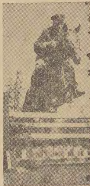
ki, Szwajcarii, Włoch. Zawarto szereg kontraktów. Dla lepszego zaprezentowania walorów koni, giełda w Łącku połączona była z pokazami jeździeckimi koni przeznaczonych na sprzedaż. Na zdjęciu: w skoku przez przeszkodę.

Kon jako siła pociągowa znika już prawie z przemysłu, systematycznie też zmniejsza się liczba tych zwierząt w gospodarstwie wiejskiej. Są to posunięcia oczywiście i słuszne, trzeba bowiem pamiętać o tym, iż utrzymywanie jednego konia kosztuje przeciętnie tyle, ile dwóch krów. Nie znaczy to jednak wcale, że zanika w Polsce hodowla koni. Przeciwnie, w ostatnich latach poważnie się ona rozwinięła (w Państwowych Gospodarstwach Rolnych) i konie rzeźne, robocze i sportowe stały się jedną z naszych pozycji eksportowych. W roku ubiegłym otrzymaliśmy za nie ponad 30 milionów złotych dewizowych. Także ze względu na wysoką jakość naszych koni systematycznie rośnie ich wartość na rynkach zagranicznych. Celujemy przede wszystkim w hodowlę koni czystej krwi arabskiej (naszymi najprawdopodobniej konkurentami w tej dziedzinie są: Anglia, Stany Zjednoczone AP i Węgry) oraz tzw. rasy wielkopolskiej, której okazy używane są zarówno do jazdy, jak i do pracy.