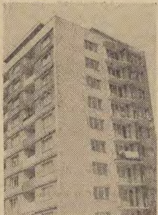
BUDYNEK PRZY UL. PIOTRKOWSKIEJ 203/205

Autorzy: architektura — inż. arch. Nowosadzki („Miastoprojekt” — Gdańsk) — adaptował mgr inż. arch. Cz. Kazimierski („Miastoprojekt” — Łódź), konstrukcja — inż. J. Drzewiński, wykonawca: LPBM nr 3, kierownik budowy — inż. W. Głodowski.