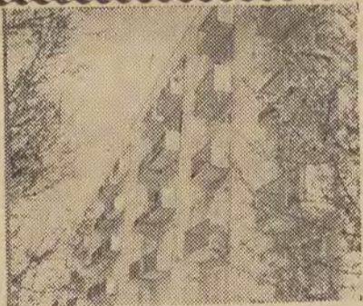
BLOK NR 218, PRZY UL. UMINSKIEGO 3 NA DĄBROWIE

Autorzy: architektura — mgr inż. arch. W. Z. Trelowiec, konstrukcja — inż. J. Frey (LPBW „Dąbrowa”), wykonawca — LPBW-2, kier. budowy — techn. M. Loboda.