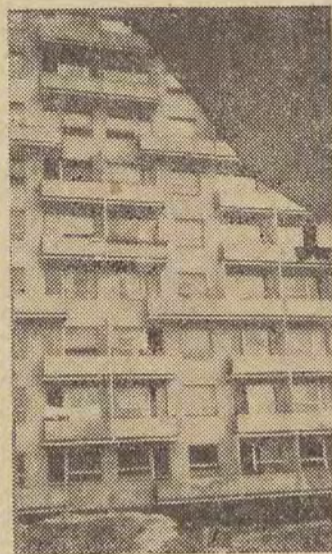
DOM PRZY UL. NARUTOWICZA 97/103

Autorzy: architektura — mgr inż. arch. A. Zwierko, konstrukcja — inż. B. Kapijanak („Miastoprojekt — Łódź”), wykonawca: LPBM nr 1, kierownik budowy — inż. Furmańczyk.