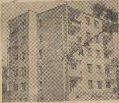
DOM PRZY UL. NEONOWEJ 9, na osiedlu Widzew-Zachód.

Autorzy: architektura — mgr inż. arch. J. Michałowicz i mgr inż. J. Siemaszko (konstrukcja — „Miastoprojekt — Łódź”), wykonawca LPBU — kierownik budowy — inż. J. Adamiak.