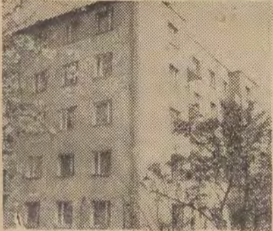
DOM PRZY UL. RZGOWSKIEJ 79

Autorzy: architektura — inż. arch. A. Wimmer, konstrukcja — inż. B. Szachlowski („Miastoprojekt — Łódź”), wykonawca — LPBM nr 3, kierownik budowy — inż. W. Stencel.