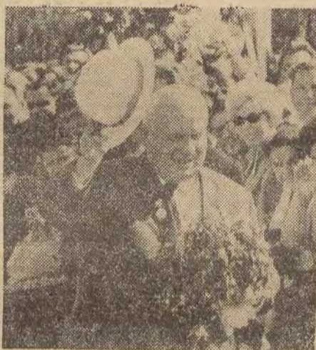
Na zdjęciu: mieszkańcy Moskwy witają na lotnisku Wnukowo premiera N. S. Chruszczowa powracającego z podróży do ZRA.

W Moskwie podano do wiadomości, że premier Chruszczow złoży wizytę w Danii w dniach 16-21 czerwca, w Szwecji w dniach 22-27 czerwca, a w Norwegii — w dniach 29 czerwca — 4 lipca. Jak wiadomo, rządy Danii, Szwecji i Norwegii zaprosiły szefa rządu radzieckiego, aby złożył w tych krajach wizytę w dogodnym dla siebie czasie.