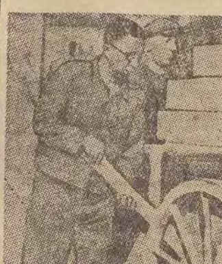
Tak pracują naukowcy w Niemczech zachodnich

„Wziąłem się do pracy fizycznej, ponieważ — mimo podejmowanych starań, nie znalazłem takiego zajęcia, które by odpowiadało mojemu wykształceniu i fachowości...“