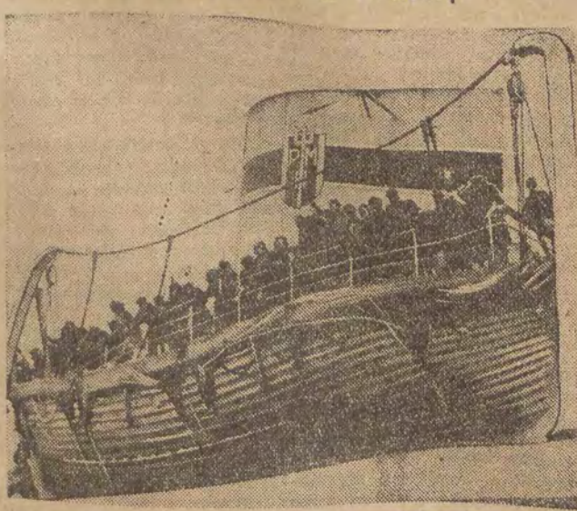
Na pokładzie M/S „Batory” przybyło na wczasy do kraju 900 dzieci polskich z Francji. NA ZDJĘCIU: Dzieci na pokładzie „Batorego” w porcie gdyńskim.