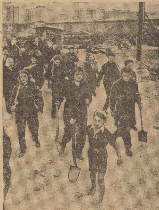
Zespół dramatyczny teatru drezdeńskiego, bawiący obecnie w Łodzi, w czasie swego pobytu w Warszawie wziął ohołotniczy udział przy odgruzowaniu Muranowa. — Na zdjęciu: Grupa artystów niemieckich udaje się na miejsce pracy.