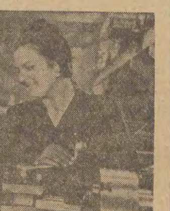
Zespół pracowników fabryki im. Kirowa w Leningradzie dla uczczenia 34 rocznicy Rewolucji Październikowej wykonał już w październiku roczny plan produkcji.