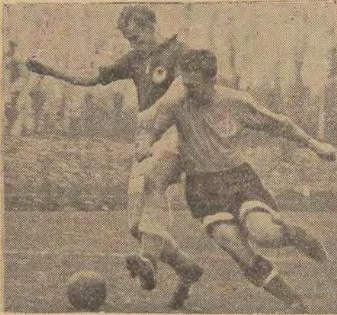
Indywidualny pojedynek piłkarzy podczas meczu tbiliskiego Dynamo z reprezentacją Górników.

cy. Organizowane w Hucie „Kościuszkow” z okazji Miesiąca Połączenia Przyjaźni Polsko-Radzieckiej imprezy i odczyty pogłębiły wśród załogi wiedzę o życiu i osiągnięciach narodów radzieckich oraz ugruntowały braterski sojusz i przyjaźń między Polską i Związkiem Radzieckim”.