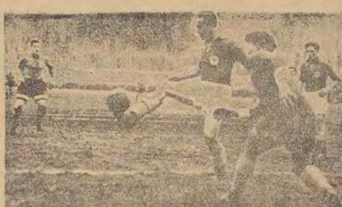
Tym razem sytuacja pod bramką polskich Górników została wyjaśniona.

„Jesteśmy szczęśliwi, że możemy poznać ludzi i sportowców odrodzonej Polski Ludowej, którzy razem z narodami Związku Radzieckiego budują szczęśliwą