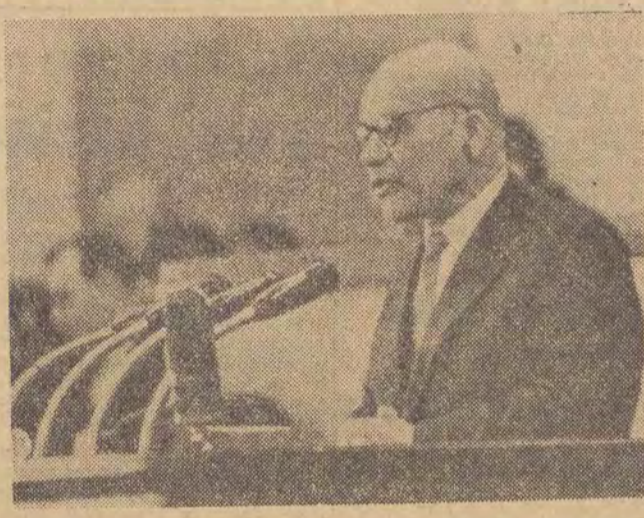
Na zdjęciu: Władysław Gomułka przemawia na XXI Zjeździe KPZR

„Dzisiaj, dziś“ — odpowiedział ze spokojem i uśmiechem N. S. Chruszczow.