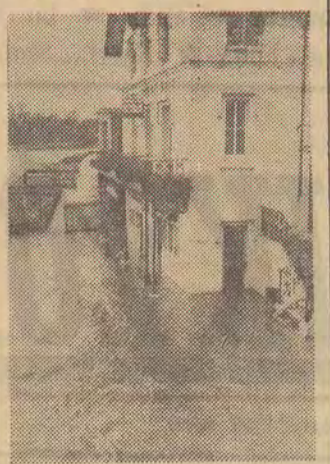
Wskutek ulewnych deszczów różne okolice Anglii zostały dotknięte powodzią. Na zdjęciu: miasto Windsor zalane wodami Tamizy.