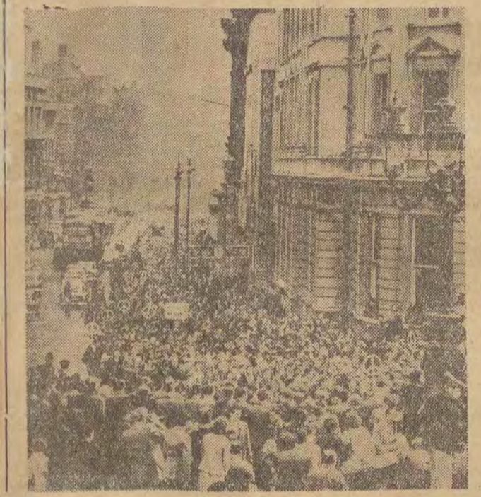
W Londynie odbyła się największa z dotychczasowych demonstracji przeciwko zbrojeniom atomowym. Wiece na Trafalgar Square był zakończeniem 83-kilometrowego marszu 3 tysięcy Brytyjczyków, który rozpoczął się w Aldermaston i rozrósł do 10-tysięcznego pochodu.

Na zdjęciu: pochód na ulicach Londynu.