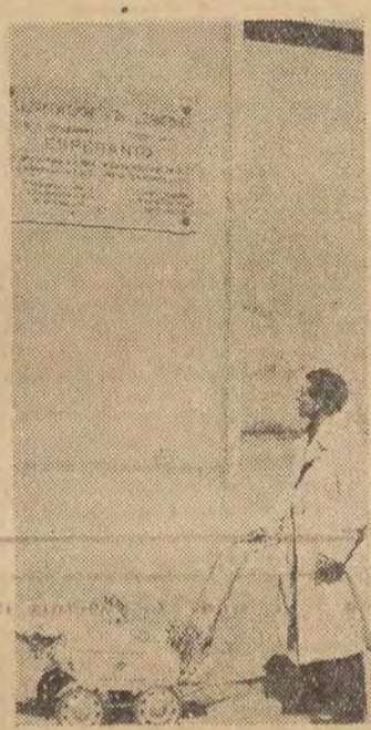
Na zdjęciu: tablica pamiątkowa, wmurowana w ścianę domu w Łodzi, w którym mieszkał Zamenhof.

— O, tak. Posiadaliśmy kontakty dosłownie z całym światem.