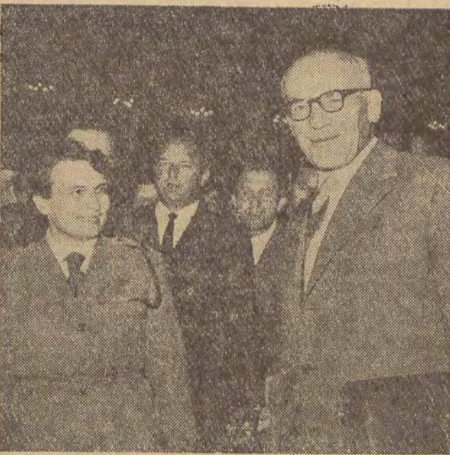
W pierwszym dniu obrad walnego zjazdu ZHP wziął udział I sekretarz KC PZPR — Władysław Gomułka. Na zdjęciu: Wł. Gomułka wśród harcerzy.

W dalszej części statutu zawiera teksty obietnicy i prawa zuch, przyrzeczenia i prawa harcerskiego oraz zobowiązania instruktorów. Po wymienieniu form, jakimi posługuje się ZHP dla osiągnięcia swych celów w chowawczych, statut mówi o tym, kto może być członkiem związku oraz instruktorem ZHP. Następne paragrafy dotyczą obowiązków i uprawnień instruktorów. Ostatnie rozdziały statutu poświęcone są ustrojowi związku, władzom naczelnym oraz terenowym i zawierają podstawowe sformułowania dotyczące rad i kół przyjaźni harcerskich.