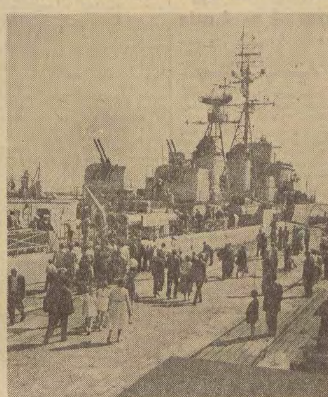
1. VII. 1958 r. wpłynął na wody Zatoki Gdąńskiej okręt Republiki Francuskiej „Guepratte”, nowoczesny niszczyciel należący do pierwszej lekkiej eskadry atlantyckiej Francuskiej Marynarki Wojennej.