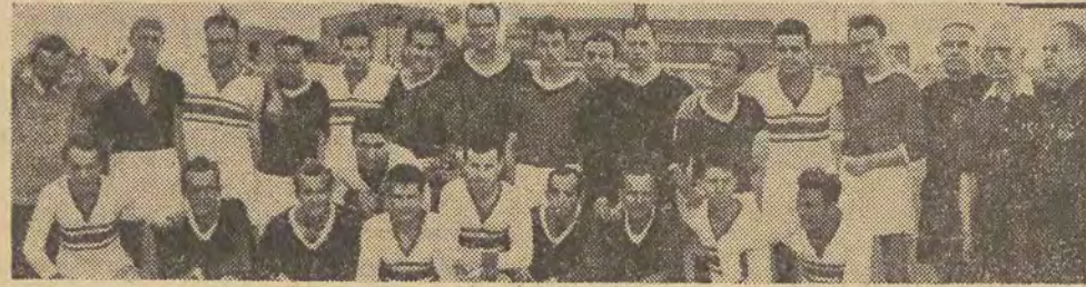
Drużyny Spartacusa (Węgry) i łódzkiego Startu przed meczem, zakończonym zwycięstwem piłkarzy węgierskich 4:2.