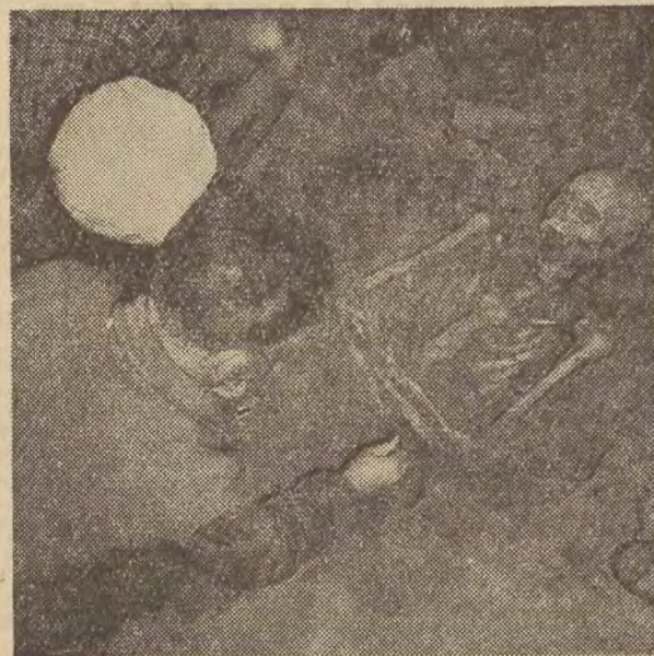
Od kilku tygodni trwają na polach Grunwaldu prace wykopaliskowe. Prowadzi je ekipa archeologów warszawskich pod kierownictwem prof. Zdzisława Rajewskiego. Na zdjęciu: znaleziony na polach Grunwaldu szkielet nosi ślady cięcia mieczem.