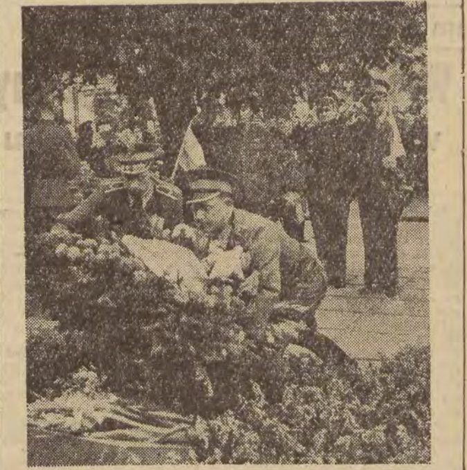
26. VIII. 1959 r. w 15 rocznicę śmierci na Starym Mieście w Warszawie członków sztabu Armii Ludowej przedstawiciele partii, WP, władz, organizacji społecznych i społeczeństwa złożyli wieńce na płycie pamiątkowej przy Krakowskim Przedmieściu.

Jak wykazało śledztwo, oskarżony Keimling dostarczył swym