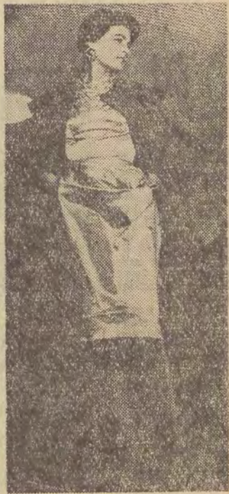
W Warszawie odbył się pokaz modeli na sezon jesenny opracowanych przez Przedsiębiorstwo Państwowe „Moda Polska”. Na zdjęciu: suknia wieczorowa i modny płaszcz.