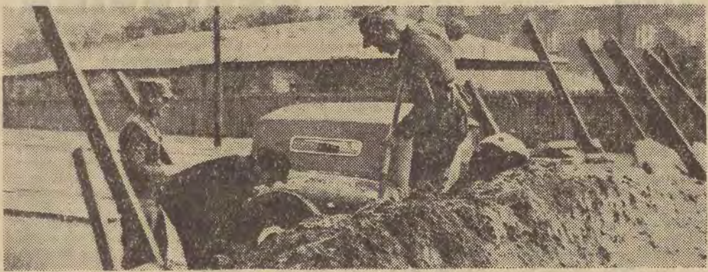
Na zdjęciu: umacnianie zapór przeciwczołgowych.