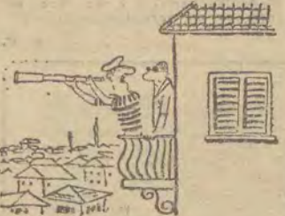
Tak jak mówilem — pokój z widokiem na morze!