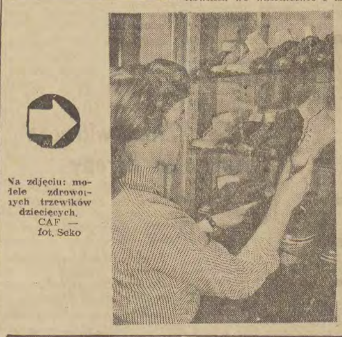
Na zdjęciu: modele zdrowotnych trzewików dziecięcych.