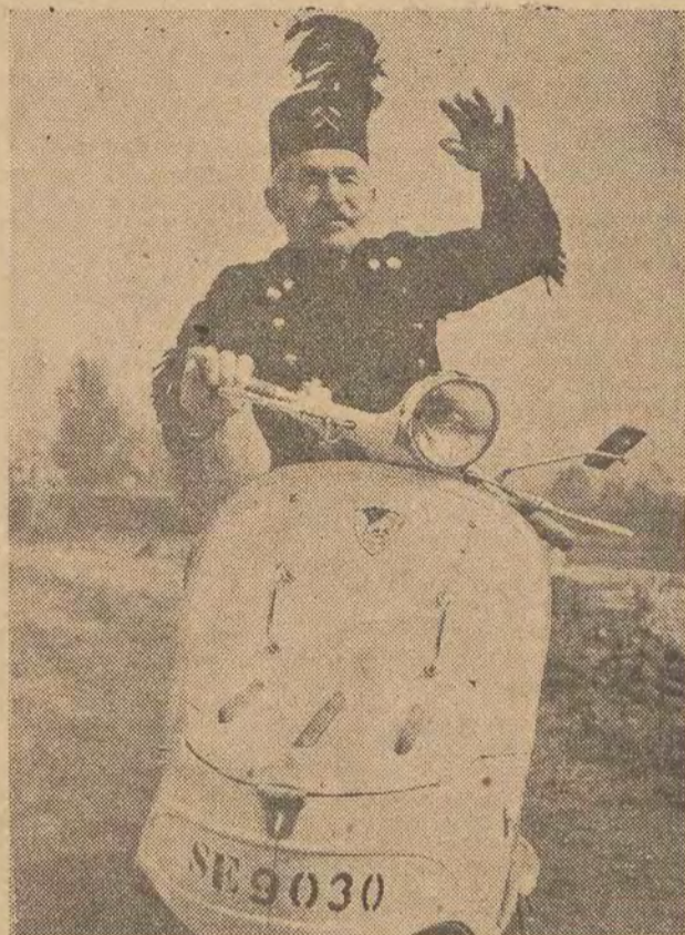
Z okazji górniczego święta, na str. 3 zamieszczamy wywiad z min. górnictwa i energetyki — inż. J. Mitreją.

Eisenhower powróci do Waszyngtonu w dniu 23 grudnia.