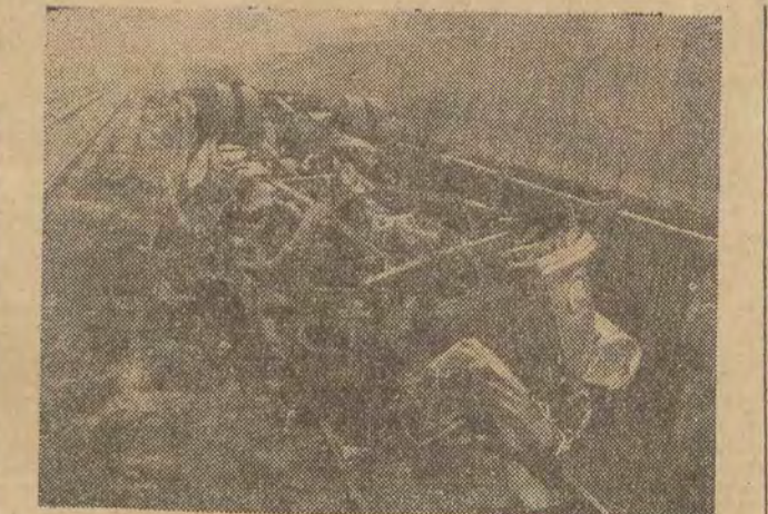
Na zdjęciu: szczątki autobusu na miejscu wypadku.

nak o zapewnienie pracownikom fizycznym niezbędnego minimum skierowań. FWP podejmuje także prace wstępne nad budową nowych obiektów wypoczynkowych. Przygotowuje się dokumentację techniczną dla ośrodków wczasowych, które mają powstać w Krynicy na zboczu Góry Parkowej, w Kolobrzegu tuż przy plaży oraz w Zakopanem (prawdopodobnie w centrum) — każdy z tych ośrodków składać się będzie z kompleksu domów wypoczynkowych dysponujących ok. 300 miejscami.