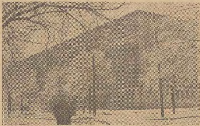
Gmach główny biblioteki wzniesiony z elementów prefabrykowanych. Monumentalna elewacja, nowoczesne gustowne wnętrza, doskonałe warunki do pracy dla czytelników. Na zdjęciu: widok na róg ul. Matejki i Narutowicza.

Na specjalną uwagę zasługuje tu pracownia mikrofilmów, która już teraz zaopatrzona jest w zagraniczną aparaturę do ich produkcji, powielania i suszenia. Rozwój tego działu jest w szerokim