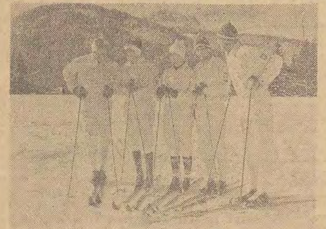
Ekipa polskich narciarzy i narciarek opuściła wczoraj Zakopane, aby w niedzielę wyruszyć w daleką podróż do Squaw Valley, gdzie startować będzie w Zimowych Igrzyskach Olimpijskich.