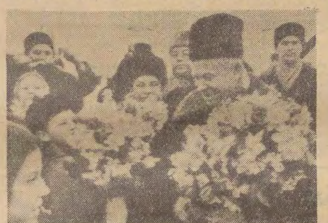
Pełnienie na lotnisku Wnukowo w Moskwie. Na zdjęciu: pionierzy wręczają kwiaty N. S. Chruszczowowi.