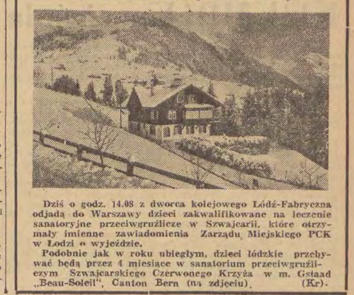
Dzisiaj o godz. 14.08 z dworca kolejowego Łódź-Fabryczna odjadą do Warszawy dzieci zakwalifikowane na leczenie sanatoryjne przeciwgruźlicze w Szwajcarii, które otrzymały imienne zawiadomienia Zarządu Miejskiego PCK w Łodzi o wyjeździe.