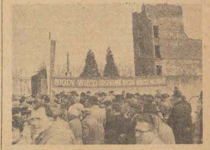
Z okazji obchodu „Międzynarodowego Dnia Solidarności Bojowników Ruchu Oporu, odbył się w ub. niedzielę w obozie kaźni na Radogoszczu wiec zorganizowany przez Łódzki KFJN oraz Zarząd ZBoWiD.

Mimo niesprzyjającej pogody, tłumy łódzian przybyły na miejsce martyrologii, gdzie przed przeszło 15 laty gineli paleni żywcem przez oprawców hitlerowskich Polacy. Z powagą na twarzach patrzone na wypalone mury fabryczne, które kryją w sobie tragedię tysięcy niewinnych ofiar.