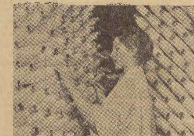
W Gorzowie Zakładach Włókien Sztucznych.