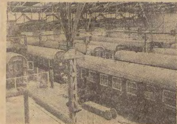
Państwowa Fabryka Wagonów we Wrocławiu „PAFAWAG” — czołowy zakład Ziemi Zachodnich.