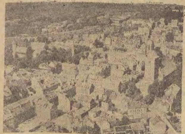
Z lotu ptaka.