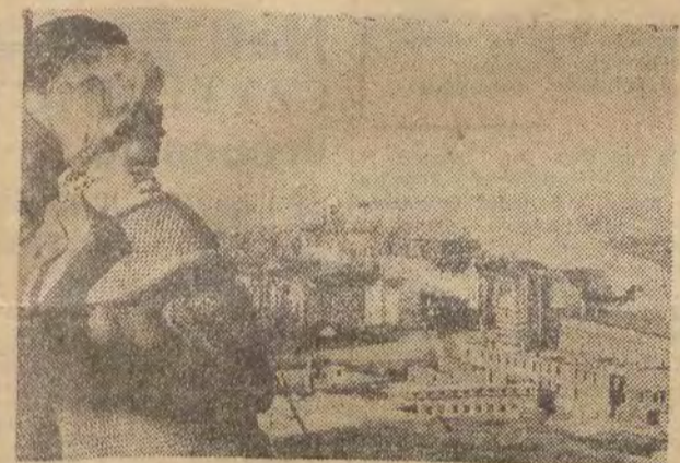
Widok na Zamek Piastowski i Odrę.