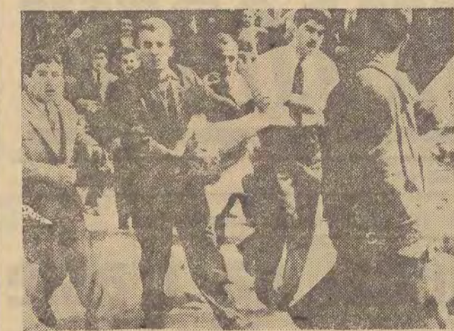
Na zdjęciu: studenci biorący udział w demonstracji antyrządowej na ulicach Stambułu niosą rannego kolegi.

PARYŻ (PAP). — Według depeszy zachodnich agencji prasowych, sytuacja w Turcji uległa pewnemu uspokojeniu. Godzina policyjna obowiązuje nadal, ale z 20 przesunięta została na 22. W Ankarze już 10-osobowe grupy „moss” się zbierają na ulicy, w Stambule natomiast tylko trzyosobowe. Jedynym wyjątkiem są konduktory pogrzebowe, w których może wziąć udział 10 osób.