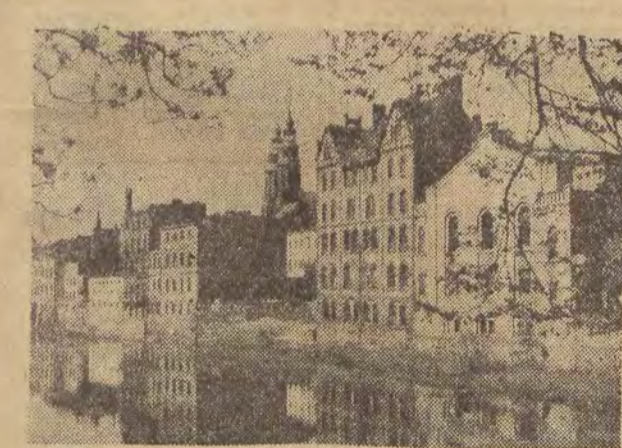
Pochodzący z IX wieku gród Opolan — Opole stanowi dziś po 3ny ośrodek gospodarczy i kulturalny.