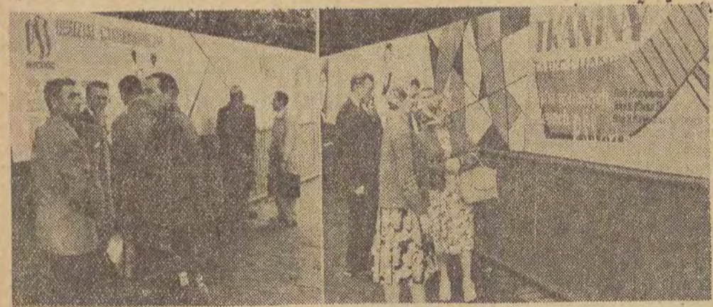
Oto plot przy ulicy Kopernika, w pobliżu skrzyżowania z ul. Łakową. Wykorzystano go dla... reklamy. Dobrej i aktualnej reklamy — w miarę deszczoodpornej wprowadzić, ale „trafiącej w sedno”. Estetyczne plaskie reklamowe przyciągają nawet oczy przechodniów spieszących na Dworzec Kaliski.

DZIS ODBYLIŚMY SPACEREK BARDZO KRÓTKI — A JEJEGO REZULTATY PRZEDSTAWIAMY POD HASŁEM: „ŁODZIANIE — UWAGA NA PLOTY!” WEZWANIE TO DEDYKUJEMY RÓŻNYM PRZEDSIĘBIORSTWOM, SPÓŁDZIELNIOM, ZAKŁADOM GASTRONOMICZNYM I T.P. A DLACZEGO DEDYKUJEMY — ZOBACZCIE SAMI!