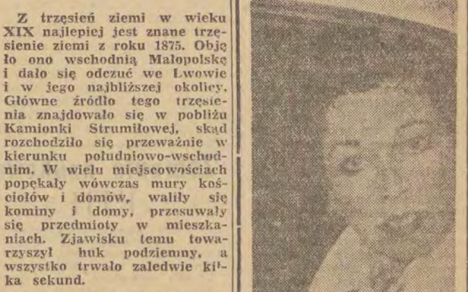
Vivien Leigh rozwodzi się

„Rok 1000 — czytamy w niej — przyniósł z sobą wiele osobliwych zjawisk, a zwłaszcza trzęsienie ziemi pełne groźby i postrachu. Dnia 5 maja 1200 r. trzęsienie ziemi w Polsce i w krajach przyległych przypało w samo południe i w następnych dniach po kilkakroć powtarzające się, wiele powywracało wież, domów i grodów, co iż w polskim kraju rzadko się zdarza, wzięte było za dziw wielki, a niektórych przesadną napelniło trwoga. Dnia 31 stycznia roku 1257, około godziny zwaną trzecią (hora tertiarum), w Krakowie i we wszystkich miastach i krainach polskich było trzęsienie ziemi, które u Polaków, niezwykłych takiego zjawiska, stało się dziwem straszliwym. Roku 1228 było trzęsienie ziemi, które się dało uczuć w całej Polsce, a także w Czechach, Rusi i Węgrzech. Dnia 5 czerwca r. 1443 było trzęsienie ziemi w Polsce, Węgrzech, Czechach i krajach sąsiednich tak gwałtowne, że wieże i gmachy murowane upadały na ziemię i najtrwalsze waliły się budowy; rzeki powystępowały ze swoich łożysk i wylasyły na