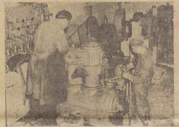
W tej chwili trwają w chłodni ostatnie roboty wykończeniowe. Na zdjęciu montaż sprzętów chłodniczych.

Wystarczy powiedzieć, że przewidywane jest poważny wzrost dziennej produkcji łódzkiej rzeźni, że w chłodni, której koszt budowy szacuje się na około 46 milionów zł, zainstaluje się nowoczesne urządzenia, dzięki którym