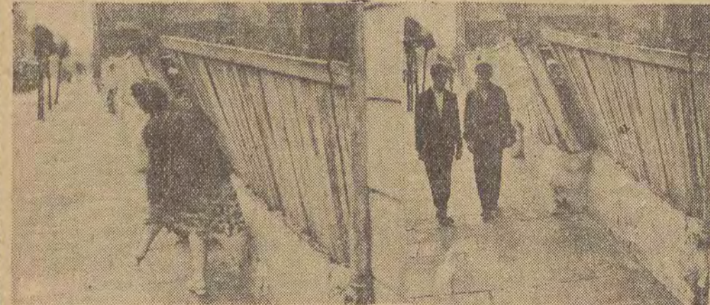
A teraz rzut oka na przeciwną stronę tej samej ulicy. Obrazek nie wymaga komentarzy. Prawda? A WIĘC — UWAGA NA PLOTY, ŁODZIANIE! REKLAMA JEST DZWIIGNIA HANDLU! Tekst: R. G.