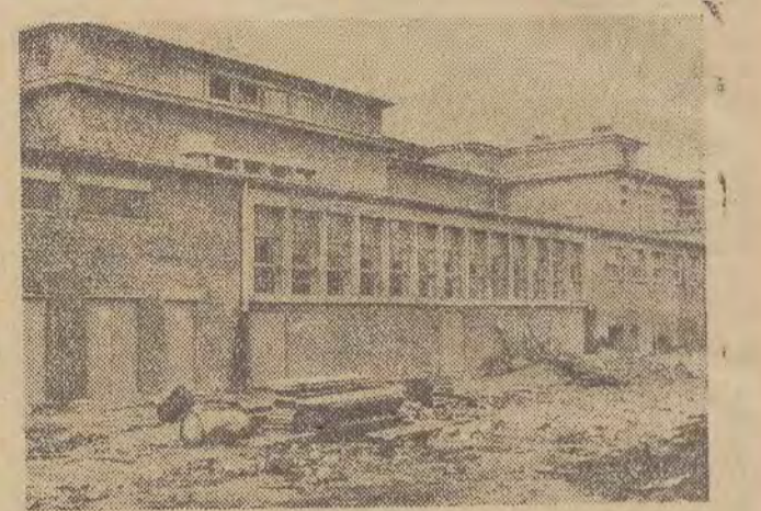
Oto prawie już zupełnie wykończony potężny gmach chłodni o kubaturze 63 tys. m 3 liczący 211 pomieszczeń.

NIE BĘDZIE WCAŁE PRZESADA, GDY POWIEMY, IŻ PO DOKONANIU ROZBUDOWY ZAKŁADÓW MIĘSNIANYCH - RZEZNI W ŁODZI, PO ODDANIU DO UŻYTKU JEDYNEJ TEGO RODZAJU W KRAJU CHŁODNI - OTRZYMAJEMY PRAWDZIWA - „FABRYKĘ MIĘSA”.