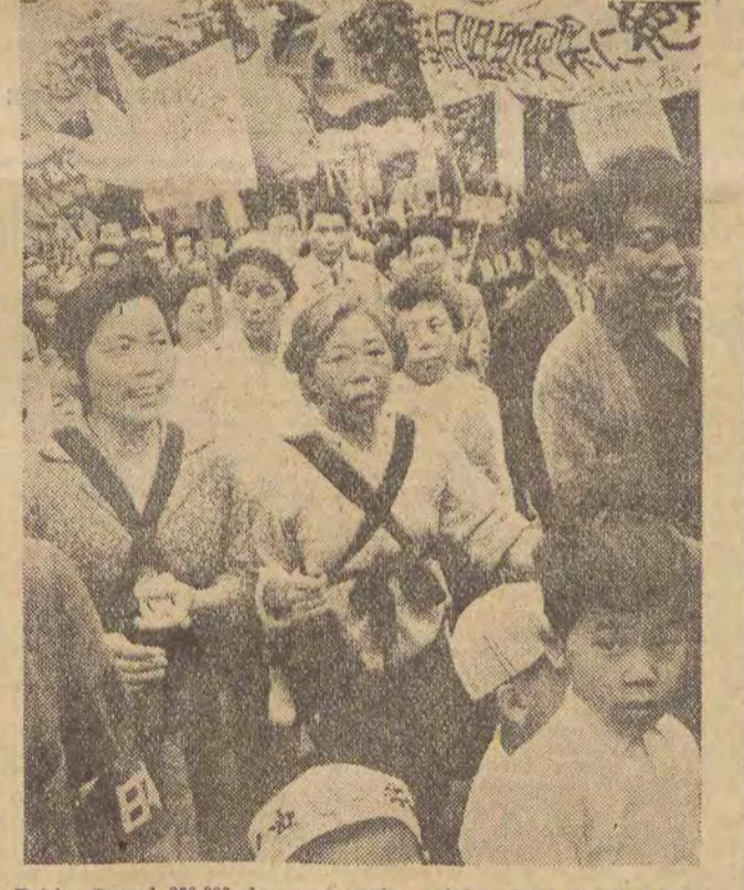
Tokio. Ponad 250.000 demonstrantów wzięło udział w marszu protestacyjnym przeciwko wizycie Eisenhowera.

W kwietniu 1945 roku, gdy wyzwoleńcy już obóz oświęcimski, postanowił Eichmann wybudować komory gazowe w getcie w Terezynie. Rozpoczęto już nawet przebudowę jednego z budynków koszarowych w Terezynie, by mógł służyć jako komora, w której można pozbawić życia jednocześnie 4 tys. osób. Nadszedł już również transport 5 ton gazu cyklo-b. Jedynie dzięki interwencji Międzynarodowego Czerwonego Krzyża, a przede wszystkim wojennemu rozwojowi wydarzeń wojennych, nie doszło