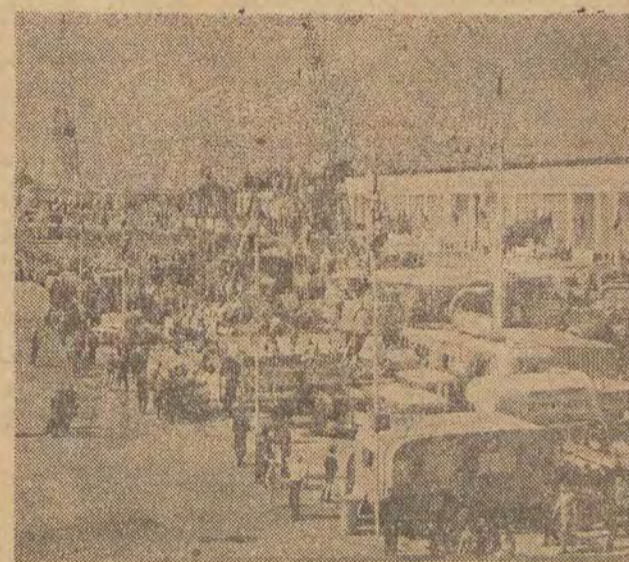
OGÓLNY WIDOK TERENÓW TARGOWYCH.

Jak dowiedzieliśmy się w rozmowie z przedstawicielem „Motowoc”, wśród nich i Polska. (Dalszy ciąg na str. 2)