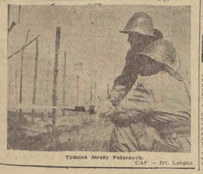
Tydzień Straży Pożarnych.

RZYM (PAP). — Korespondent PAP podaje: W czwartek wczesnym popołudniem na rzymskim lotnisku Ciampino wylądował pierwszy regularny samolot Polskiej Linii Lotniczych „Lot” typu „Convair C-440”.