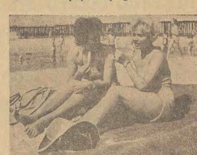
...czemuścowa daje się we znaki wczasowiczom. Toteż każda „odrobina” słońca wykorzystują w całej pełni. NA ZDJĘCIU: na plaży w Międzyzdrojach.

Państwa Polskiego podjęli ostatnio warty produkcyjne. W sumie w watach tych, które rym termin ukończenia najczęściej wypada 15 lipca br. będzie udział w naszym mieście 10.320 osób. Członkowie ZMS zobowiązali się ponadto zorganizować w tym czasie 43 brygad produkcyjnych, z których 17 już istnieje. Na przykład w Łódzkim Przedsiębiorstwie Budownictwa Uprzemysłowionego powstanie do Złotu w Grunwaldzie 20 brygad (istnieje już 7), a ponadto młodzież rozpocznie samodzielnie wykonywanie metodą uprzemysłowioną dwóch bloków mieszkalnych. Członkowie ZMS z Łodzi pracowali w okresie przed Zjazdem w swej organizacji ponad 11 tys. rob./godzin przy porządkowaniu miasta. Prace te trwały zresztą po Zjeździe i trwają jeszcze obecnie. W osiedlu Nowe Rokicie pracowało 2,5 tys. rob./godzin ZMS-owcy uratowali przed zniszczeniem wiele belek stropowych DMS, stopni i nadproży porożuczanych po terenie i poprzyspywanych ziemią przez niedbale robotników. Lista prac wykonanych i za mierzonych przez członków organizacji byłaby bardzo długa. W każdym razie ślady tej pozytywnej społecznej działalności widoczne są na każdym kroku. Łódzka młodzież będzie się miała czym poszczycić w czasie Złotu na Polach Grunwaldu. J. P.