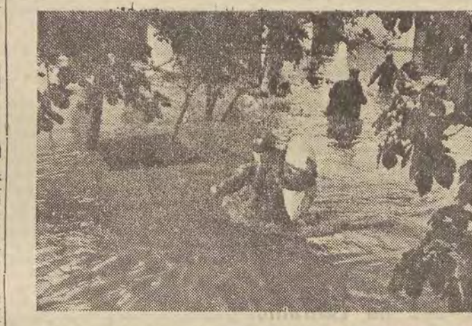
W walce z powodzią olbrzymią ofiarność i poświęcenie wykazują żołnierze Wojska Polskiego i funkcjonariusze Milicji Obywatelskiej. Na zdjęciu: ratowanie dobytku powodziem...

Bruxelles opuściła we wtorek delegacja samorządowego rządu prowincji Katanga pod przewodnictwem „ministra finansów”. Delegacja ta udała się do Paryża, „aby nawiązać kontakt z władzami francuskimi”; zamierza ona szukać poparcia dla swych roszczeń w szeregu krajów europejskich.