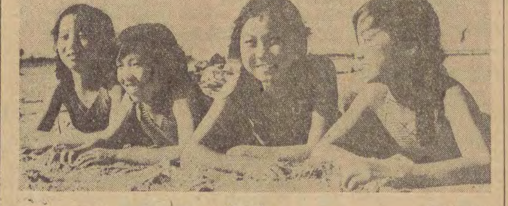
Na plaży...