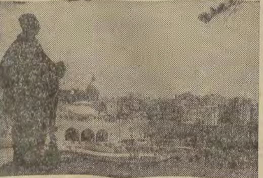
Stary port w Dubrowniku.