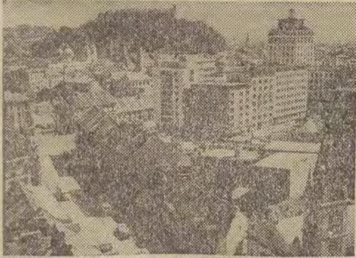
Na zdjęciu: ogólny widok Lublany — stolicy Socjalistycznej Republiki Słowenii.

Jugosławia jest pięknym krajem. Tysiące turystów z całego świata przyjeżdża tu na wypocznik i na wędrowniki po malowniczych zakątkach, jakich jest tu niezliczona ilość. Przepiękne wybrzeże nad Adriatykiem, zabytki z czasów rzymskich, uroczyste stare miasteczka i nowoczesne domy wypoczynkowe. (ad)