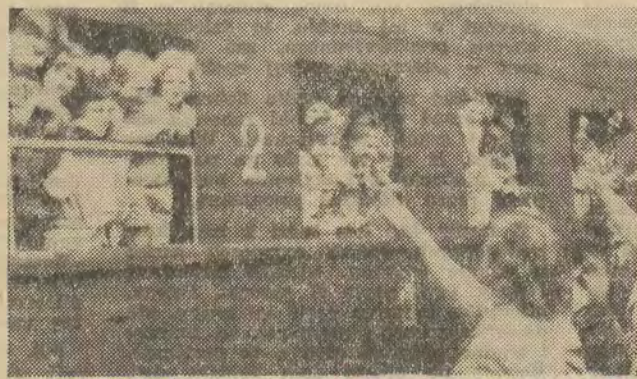
Pracy i Zakładów Graficznych.

Pociągami tym odjechało z Dworca Łódź-Kaliska blisko tysiąc dzieci, m. in. pracowników MHD Łódź - Polesie, Inspektoratu Dzielnicy Bahuty, Łódzkiego Zw. Spółdz.