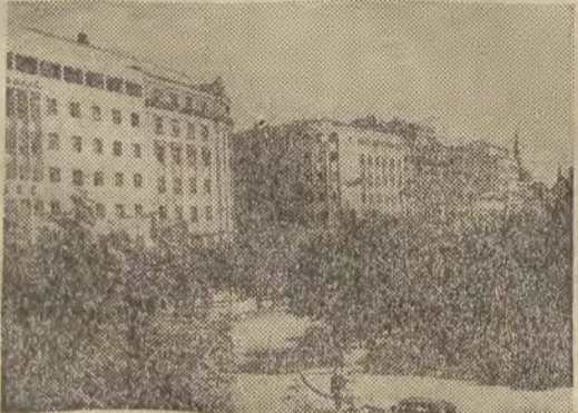
Na zdjęciu: Terazije — centrum Belgradu.