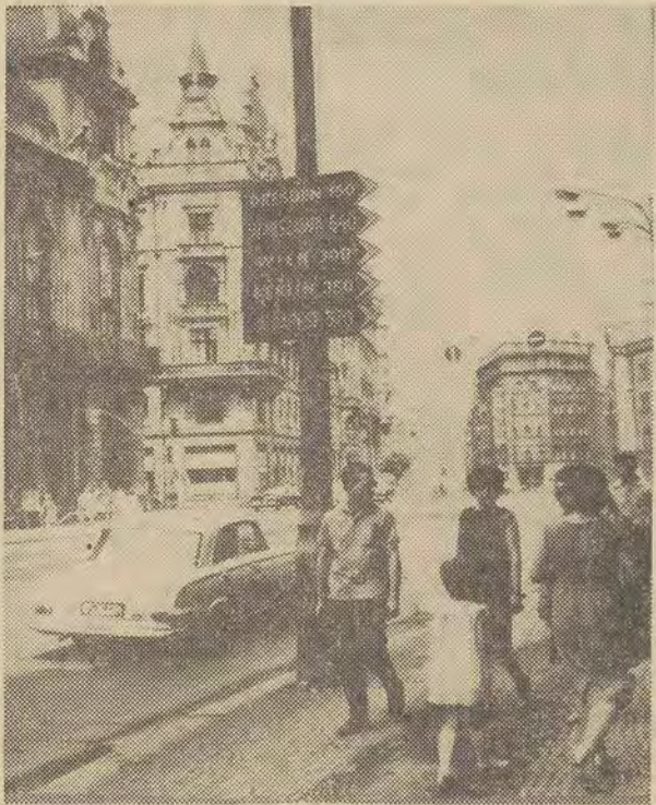
Stolica Czechosłowacji stała się ośrodkiem turystyki międzynarodowej. Na ulicach znajdują się drogowskie wskaźniki odległości do wielu miast europejskich.