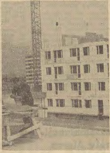
Na zdjęciu: szybko postępuje budowa bloku mieszkalnego im. IV Zjazdu partii, wznoszonego w ramach zobowiązań długofalowych podjętych na czesć Zjazdu partii.

Budowę tego bloku rozpoczęto 11. VI. br., gotowy będzie już 15 lipca br. Blok mieszkalny 10-piętrowy buduje się na Osiedlu Prototypów na Śłużewcu w Warszawie systemem eksperymentalnym — wielkopłytowym, zwanym w skrócie „WPP” (Warszawski Poligon Przemysłowy). Podczas wznoszenia tego domu oraz 20 już wybudowanych na Osiedlu Prototypów — Przedsiębiorstwo Budownictwa Doświadczalnego wypróbowało 5 nowych technologii, które uzyskały już uznanie i są obecnie wprowadzane na terenie całego kraju.