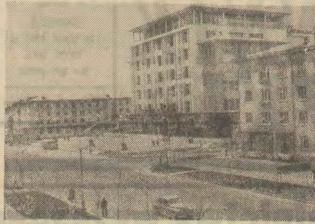
11 lipca Mongolska Republika Ludowa obchodzi 49 rocznicę zwycięstwa rewolucji ludowej i powstania państwa. Siły rewolucyjne pod przewodnictwem Suche Batera obaliły ustrój feudalny i rozpoczęły budowę socjalizmu. Dawni koczownicy żyją dziś w nowoczesnym państwie socjalistycznym, w którym rozwija się przemysł i nowoczesne rolnictwo. Powstają nowe ośrodki miejskie i przemysłowe.

(ad.) N.-z.: Aleja Pokoju w stolicy Mongolii, Ulan Bator