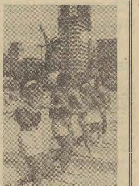
Defilują młodzi sportowcy CAF-fot. Dabrowiecki