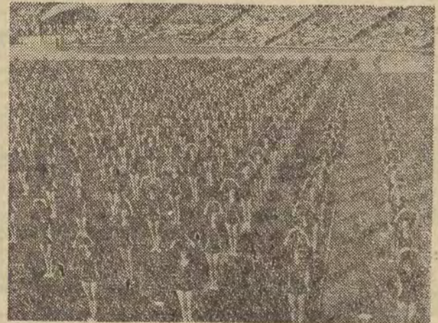
Pokaz układu gimnastycznego, wykonanego przez 1.400 dziewcząt województwa gdańskiego, związanego tematycznie z morzem oraz z życiem i pracą na morzu.