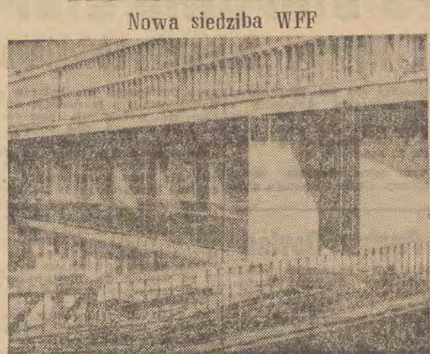
Nowa siedziba WFF architektonicznym ul. Łąkowej.

Przy ul. Łąkowej rośnie nowy obiekt Wytwórni Filmów Fabularnych. Gmach o kubaturze 18 tys. m sześć. pomieszczenia biura dyrekcji z salą konferencyjną i częścią socjalną, a więc kuchnię i stołówkę dla pracowników. Poza tym znajdują się tu — sala kinowa, biblioteka, czytelnia oraz pomieszczenia produkcyjne. Parter zajmie wydział techniki zdjęciowej z licznymi laboratoriami i pracowniami. W tym roku budynek będzie wykończony i w znacznej części ukończony. Generalny wykonawca — LPBP nr 1, projektant — „Mias”projekt Specjalistyczny — Warszawa. Nowy budynek stanie się przyjemnym fragmentem ar-